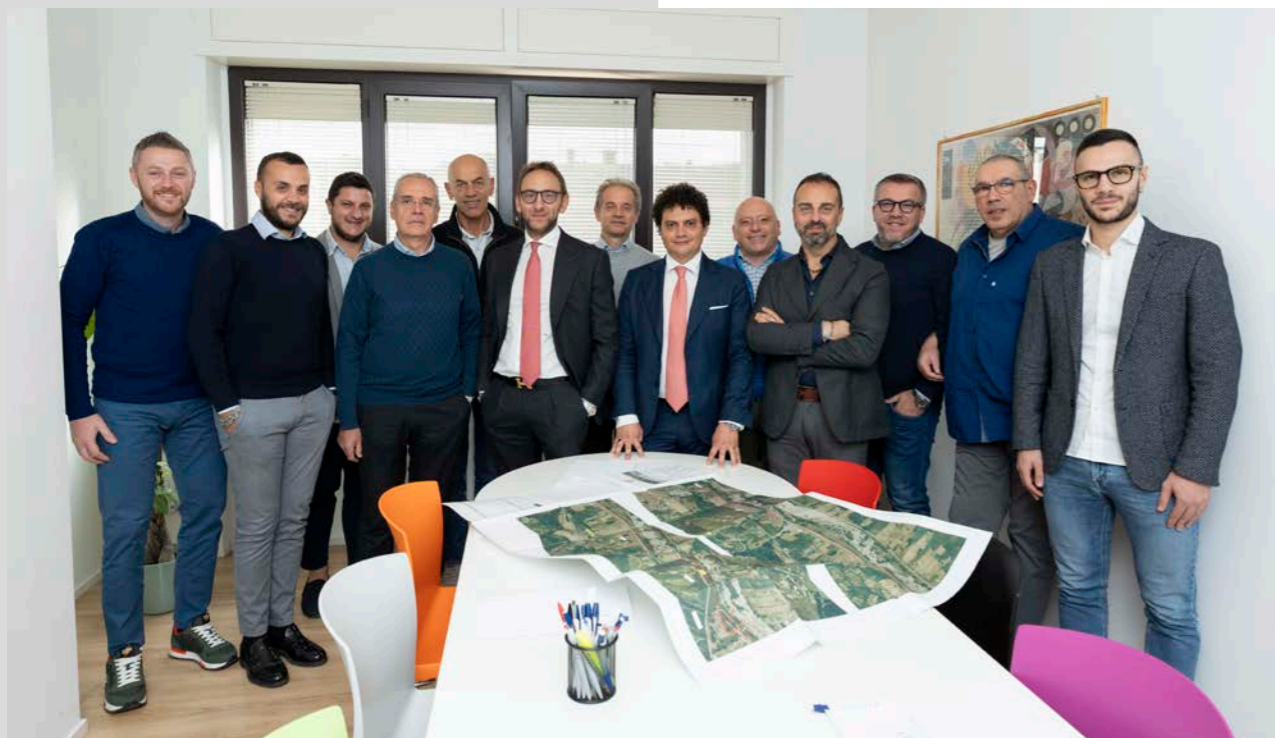
Parte del team della Mancusi Spa

cui viviamo e in cui ci auguriamo che possano vivere i nostri figli. Investiamo moltissimo nella qualità della proposta progettuale e nella formazione del team di ingegneri e professionisti che ci affiancano. In un mercato competitivo come quello dei lavori pubblici e dell'edilizia in generale, investire nella formazione diventa sempre più strategico, creando valore aggiunto sia per i dipendenti, che possono incrementare il proprio bagaglio di competenze e skill verticali, sia per l'azienda stessa che ha la possibilità di crescere e diventare sempre più competitiva ed evoluta".