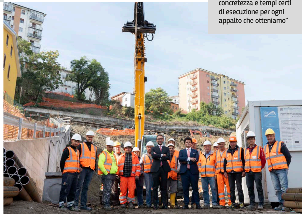
Parte del team operativo impegnato nella costruzione, per Conto del Comune di Potenza, dell'impianto pedonale meccanizzato per la riduzione del traffico veicolare della città di Potenza

"In questo momento storico è necessaria una pianificazione economica-finanziaria rigorosa che gli uffici Mancusi affrontano quotidianamente per garantire solidità, concretezza e tempi certi di esecuzione per ogni appalto che otteniamo"