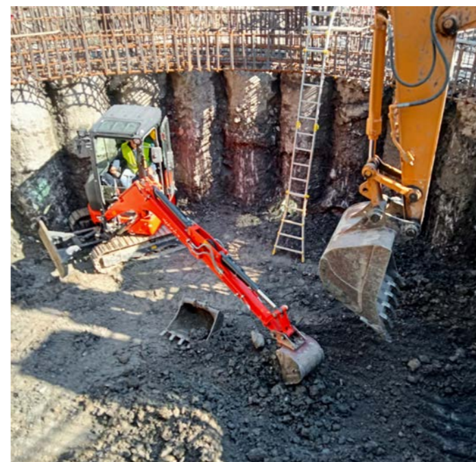
Lavori di realizzazione di un pozzo drenante a consolidamento del versante fosso "Fiumicello" al km 2+450 della Sp ex Nsa Bretella di collegamento A3-Ss 585 per conto della Provincia di Potenza

La cura e lo studio costante delle normative e delle innovazioni tecnologiche nel settore, insieme all'attenzione per i clienti sia pubblici sia privati, costituiscono le regole dell'operato aziendale. Un principio imprescindibile dell'azienda riguarda la sacralità delle risorse pubbliche